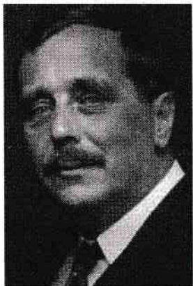
Fig. 1.2. H.G. Wells. Fotografie realizată de George Charles Beresford, în anul 1903

LIBRIS Cu siguranță, nu ne vom putea întoarce la maimuțe și idioți în 800.000 de ani! Mai probabil, vom deveni ființe asemănătoare zeilor, care vor coloniza alte planete sau stele îndepărtate. Așadar, din moment ce nu are niciun sens din punct de vedere profetic, cum de a reușit acest roman să rămână un clasic timp de mai bine de un secol, să dea naștere la două filme de la Hollywood și să inspire nenumărate continuări și derivate? După cum vom vedea, este posibil să fi subestimat puterile profetice ale lui Wells și este posibil ca această poveste să fie mult mai mult decât pare.